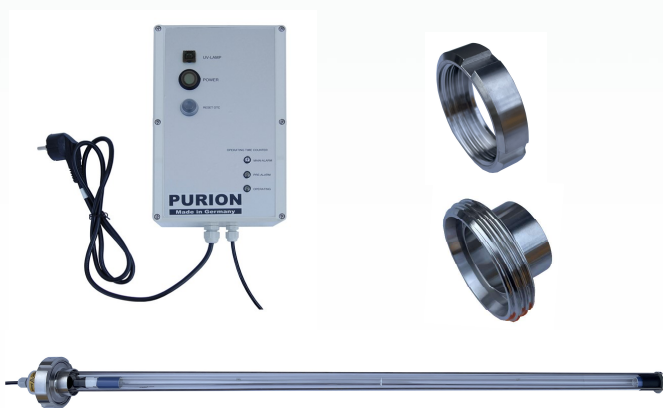
Bild: PURION weld in UV-Set 90 W & optional mit Splitterschutz

...zeichnet sich durch eine außerordentlich hohe Desinfektionsleistung bei kompakter Bauweise und geringem Energieverbrauch aus. Es ist nach geltenden Gesetzen, Normen und Richtlinien ausgeführt.